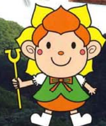
東吾妻町 マスコットキャラクター 「水山ちゃん」