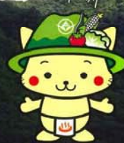
長野原町 マスコットキャラクター 「にゃがのはら」