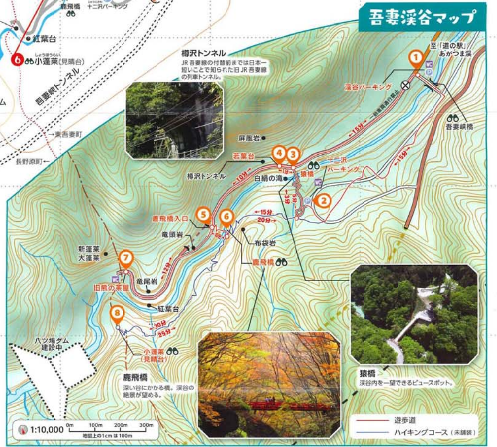
この地図の作成に当たっては国土院院長の承認を得て同院発行の基礎地図情報を使用しました。(承認番号 平 29 備使、第 522 号)