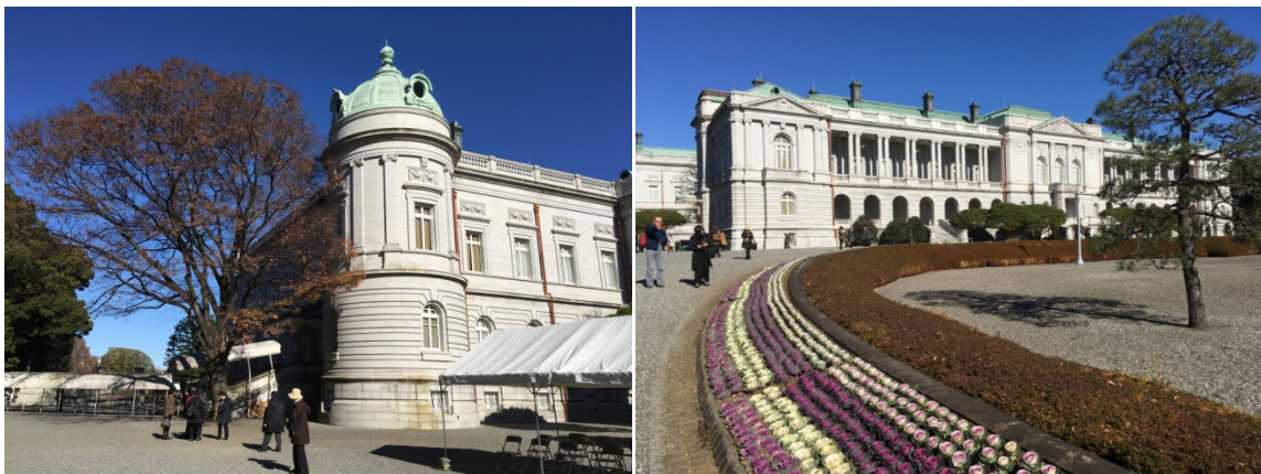
14、迎賓館主庭より本館