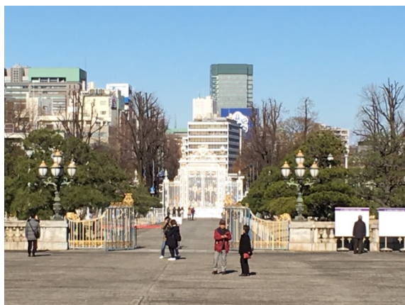
20、迎賓館本館より正門を