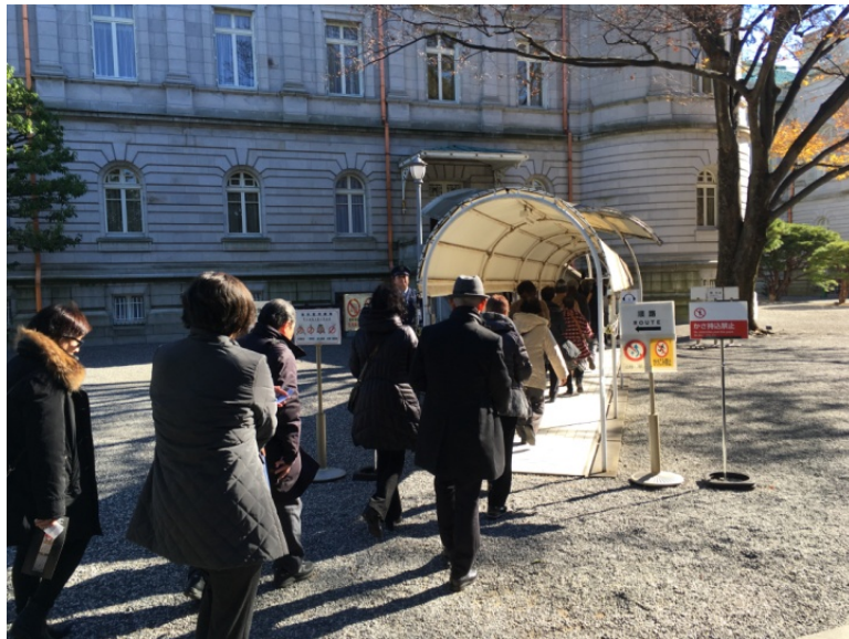
12、いよいよ迎賓館本館入場です。