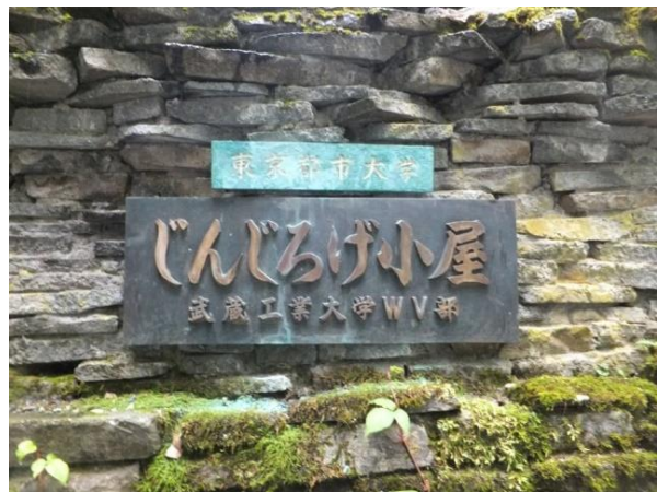
東京都市大学ネームプレート