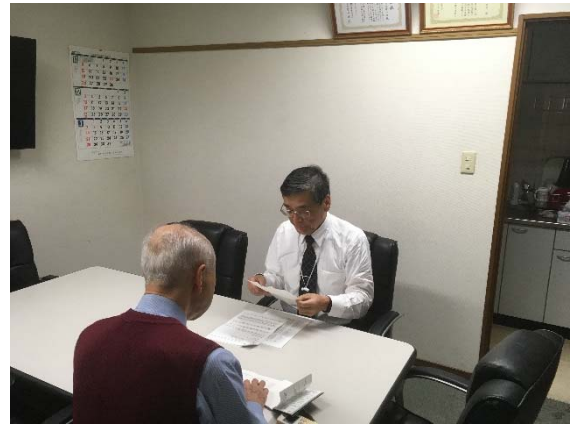
広報担当部会 編集会議 2017年12月25日 東洋電機工業東京支店