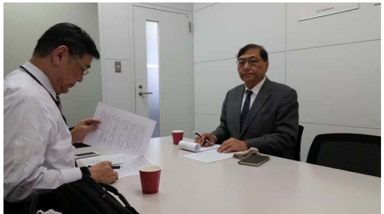
会報 HP 編集会議 2017年12月14日 水道橋大林道路本社にて