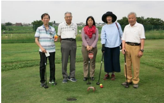
① 第一回パークゴルフ大会