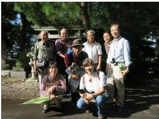
② 第一回ミステリーツアー