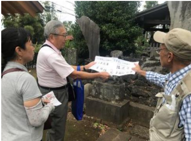
② 第二回ミステリーツアー