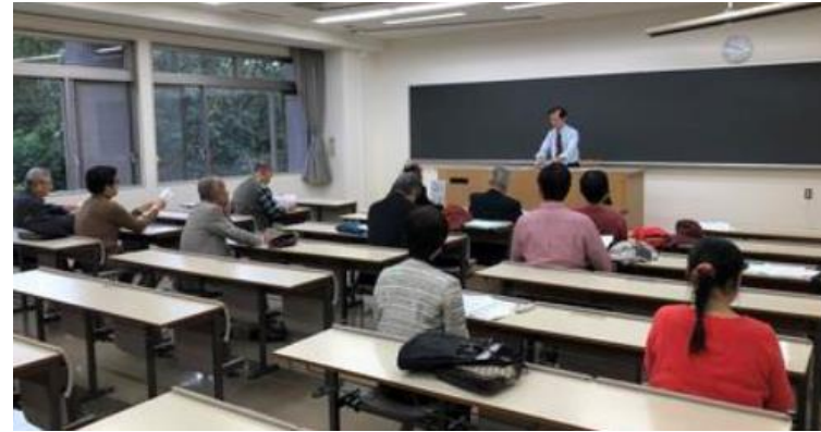
③ 平成30年度神奈川三支部総会（川崎支部）