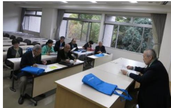
④ 平成30年度神奈川三支部総会（川崎支部）