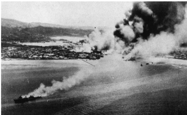
「攻撃を受けた船舶(左下)と那覇市街」

戦災史料を総括する総務省 は、全国各地の 「戦災の状況」 を集めています。その中に所蔵されている<石垣市における戦災の状況>には、1944年（昭和19年）～1945年（昭和20年）にかけての石垣町の状況が記されています。