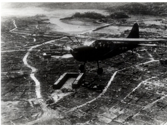
「10・10空襲とその後の市街地戦で壊滅した那覇」