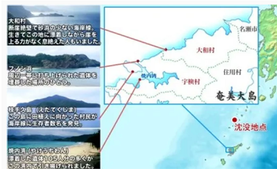
(漂流者の辿り着いた場所)