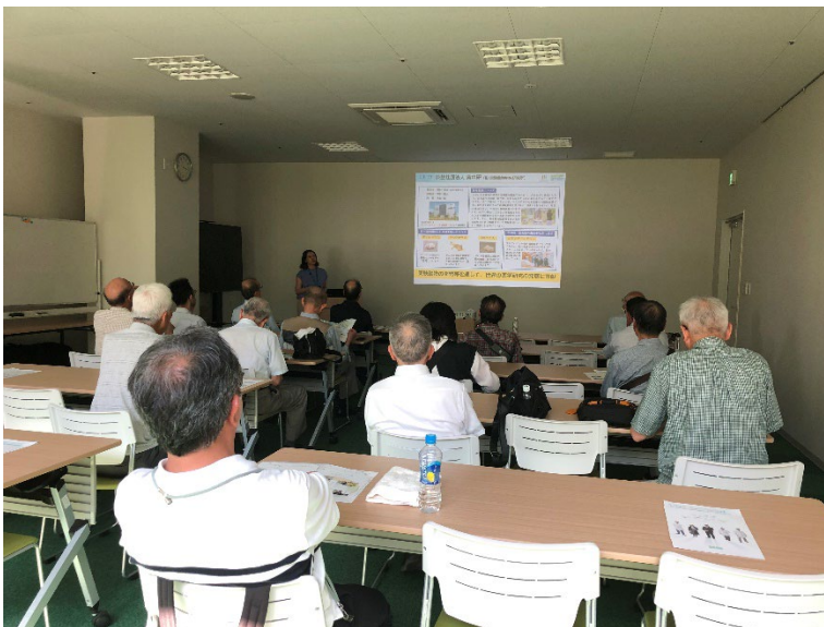
(概要説明中－川崎市臨海部)