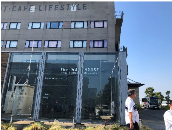
(世界初の水素ホテル)