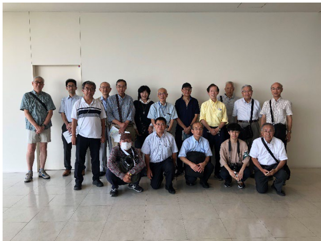
(集合写真ー黄色のシャツが山岸支部長)

○エリア内のマネジメント業務(町内会の様なもの)では、80社の内約60社が加入。