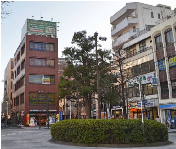
（現在の武蔵新城駅北口ロータリー）

敗戦後、GHQ が解体させて 12 社に分割しました。その内エンジン技術者を中心にして設立したのが富士重工業（元・スバル）です。工場跡地には日本鋼管の社員寮が建設され、日本鋼管は川崎臨海部の「顔」でした。川崎駅から南武線で 1 本の武蔵新城駅は、従業員寮の設置には最適でした。2002 年（平成 14 年）に川崎製鉄と合併し、翌年 JFE スチールとして発足し、現在に至っています。